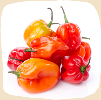
Piment Habanero frais