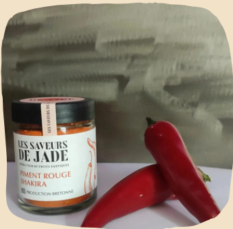
Piment Shakira frais