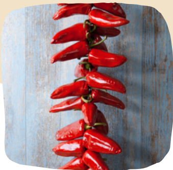
Piment en tresse