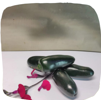
Piment jalapeno tress